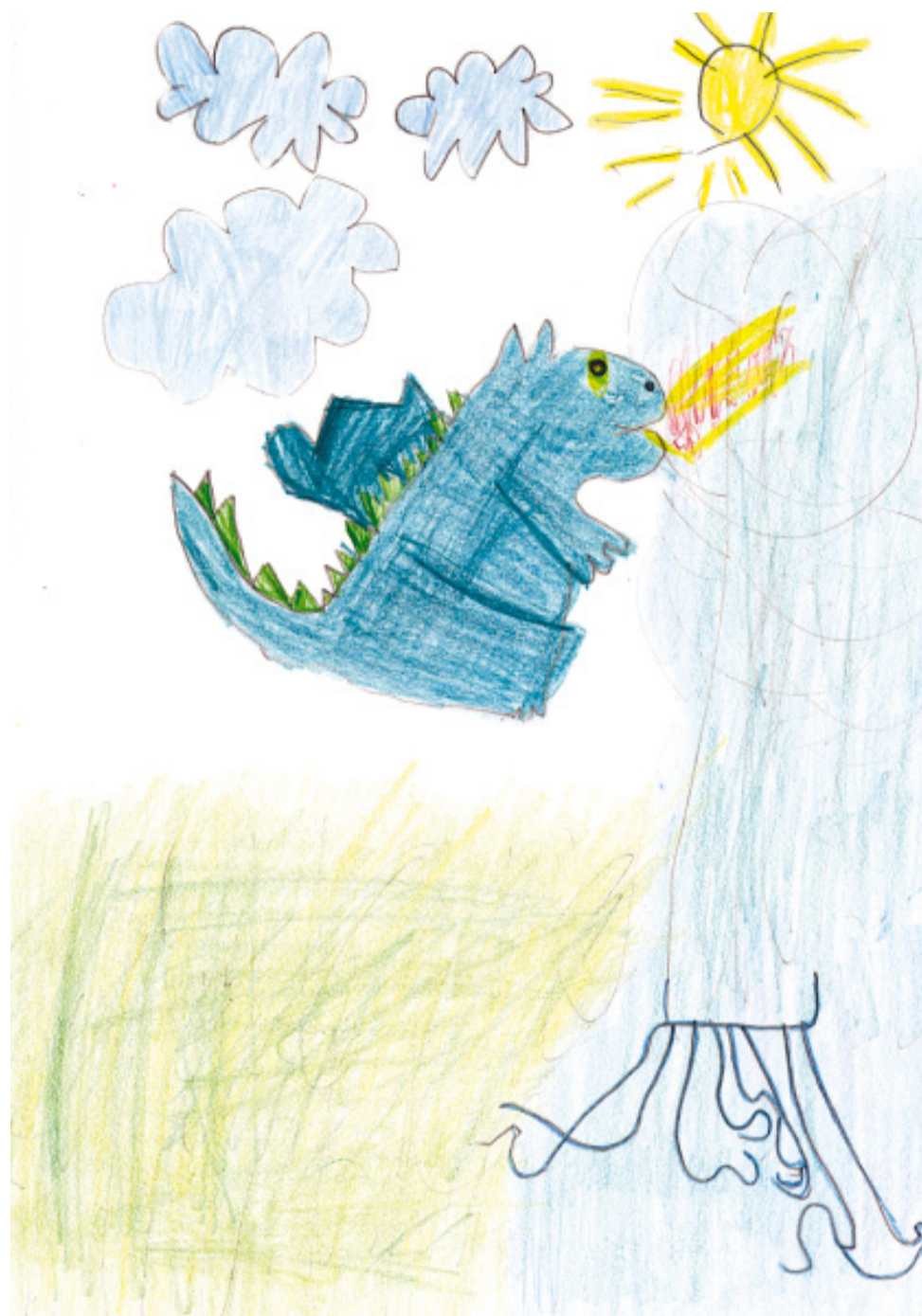
J. hat «Füürri» gezeichnet. Der Drachen ist sein Sprachrohr und kämpft gegen einen Wasserfall.

Damals, vor drei Jahren, war noch nicht klar, dass er an einer Störung leidet, die einen Namen hat: Mutismus – abgeleitet vom lateinischen Wort «mutus» für stumm. J. treibe ein mühseliges Machtspiel, meinte die Spielgruppenleiterin und interpretierte das Schweigen als bewusste Verweigerung. Bis dahin war er nicht besonders aufgefallen, ausser dass er stark auf die Mutter fixiert gewesen war und früh zu fremden begonnen hatte. Zu Hause redete er aber seinem Alter entsprechend gut und viel. Die Logopädin bestätigte, J. habe keinen Sprachfehler, sondern eine Sprechstörung. Sie diagnostizierte Mutismus. Ein Fremdwort für die Eltern. Und ein Schock. «Ich hatte keine Ahnung, was das heisst», erzählt die Mutter. Es folgten Erleichterung – endlich zu wissen, was hinter dem Verstummen steckt – und Angst. Denn nun stand fest, dass J. nicht einfach scheu oder trotzig ist. Man könnte sagen: Er nimmt sich das Recht, nicht zu reden. Doch diese Form von Nichtreden gilt als psychische Störung. Und sie irritiert, besonders in unserer Zeit, da bereits Kleinkinder in Spielhandys hineinplappern und verbale Kommunikation omnipräsent ist.